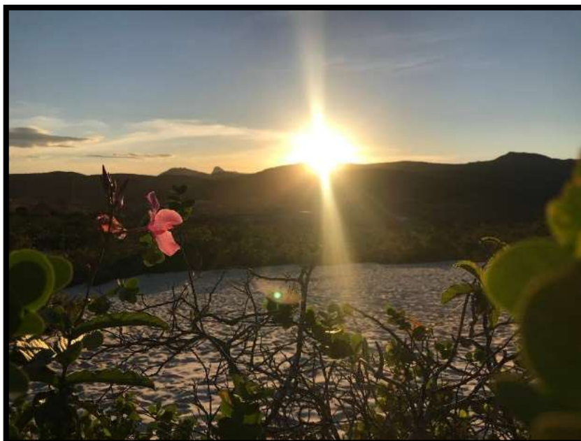
Figura 2. Imagem area branca in loco (Autor 2025)