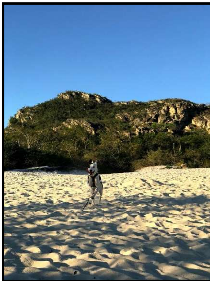
Figura 3. Imagem Area branca 2 (Autor 2025)