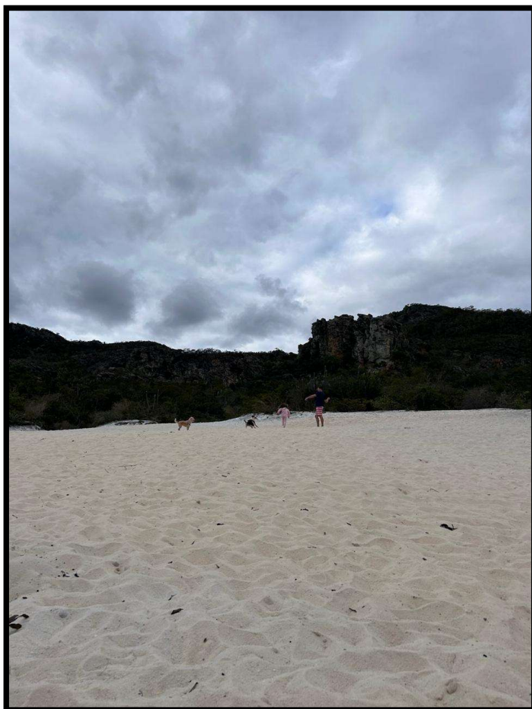
Figura 5. Imagem Areia Branca Parque Infantil (Autor Luiz Guedes 2025)