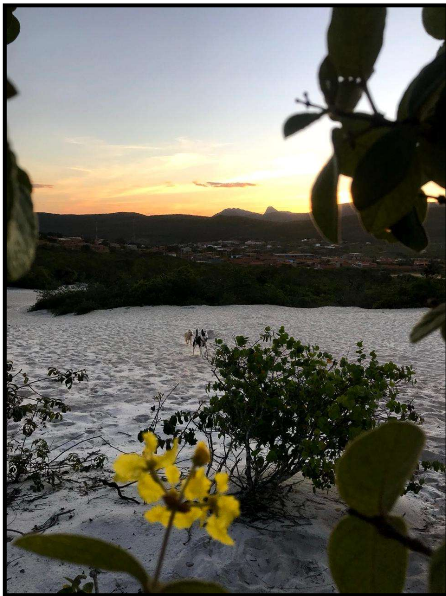
Figura 6. Imagem Areia Branca